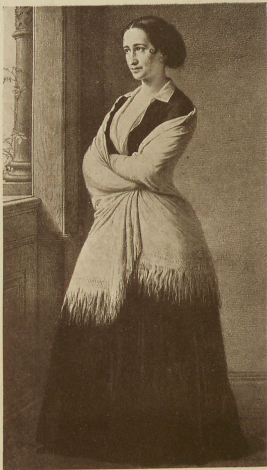
JOHANNE LUISE HEIBERG.