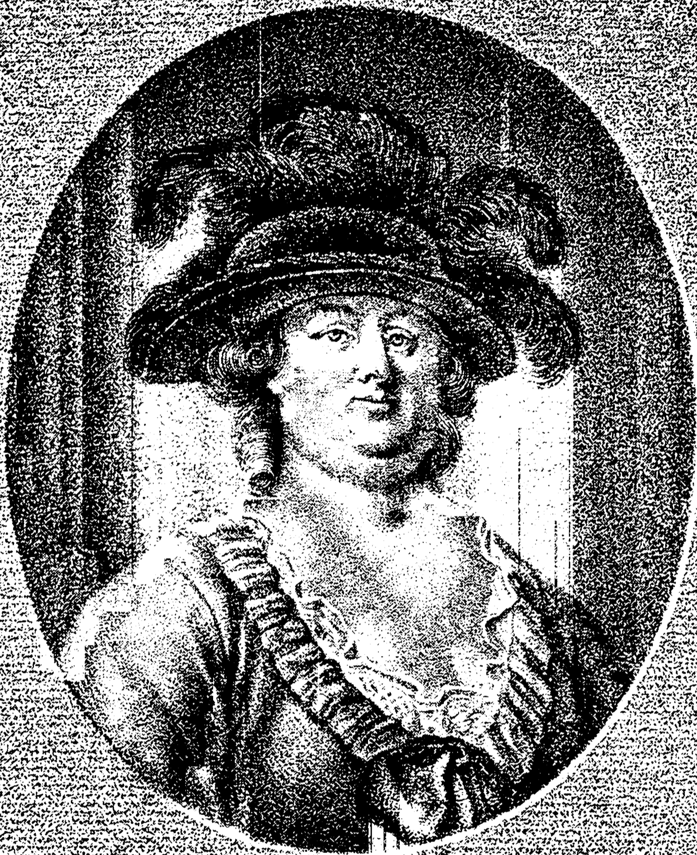
Charl. Dorot. Biehl. föd 1731. - död 1788.