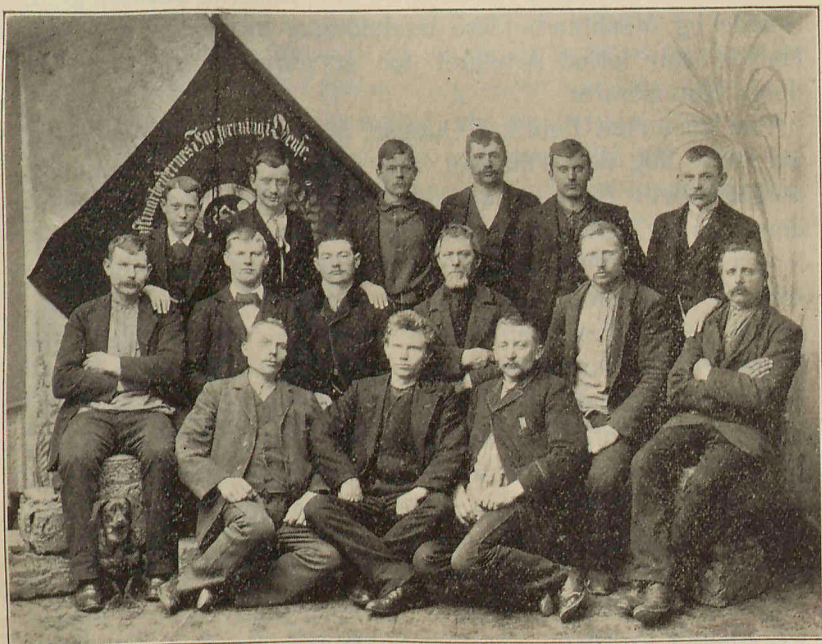
Deltagerne i Klejnsmedestrejken fra 6. Marts til 9. April 1897.

I Begyndelsen af Februar tilsendte Afdelingen Klejnsmedemestrene en Skrivelse, hvori fremsattes Forslag til en Overenskomst om Løn- og Arbejdsforhold paa Klejnsmedeværkstederne her i Byen.