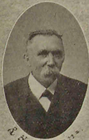
E. H. Hansens Kasserer