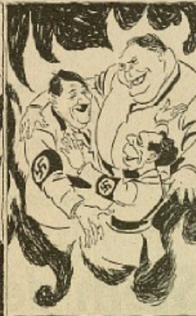
Hitler, Goebbels og Göring: Sieg heil! Vore folk vandt i Vesttyskland.