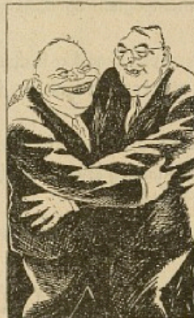
Eisenhower: Til lykke, Dulles! Der var vores mand, der sejrede i Vesttyskland.

Det gælder at oprette et fredeligt og antinazistisk, forenet Tyskland.