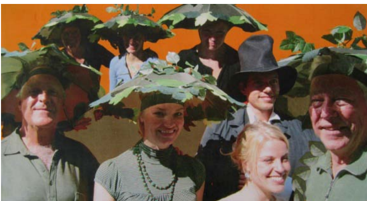
Holberg: Niels Klims underjordiske rejse

har en 6-kantet scene i loungeområdet som ramme for de mere eksperimenterede events. Biblioteket har et skuespillerensemble, bestående af både professionelle skuespillere og studerende, som spiller teater fra Holberg til Saalbach. Her samarbejdes der også med Teatervidenskab, som bl.a. afholder eksamen her i form af Performance Lectures .