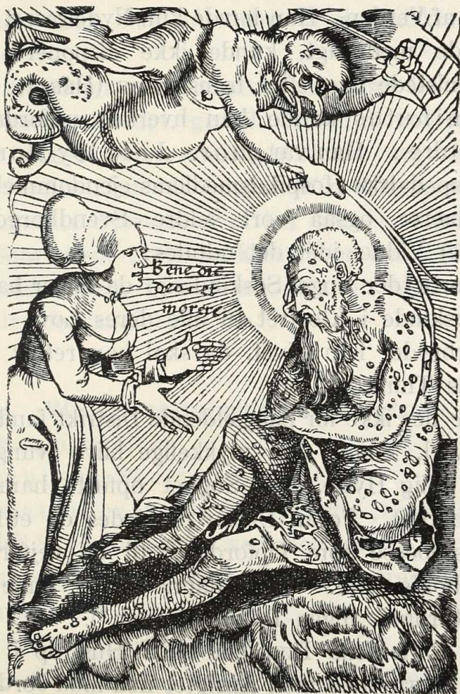
Satan slaar Job med Spedalskhed (af GERSDORFF: Feldbuch d. Wundarzney.)

stort Jagthorn i en Snor over venstre Skulder. Senere brugtes „Schellen“ og sidst Skralden. I Normandiet brugtes et Instrument, der benævnes „Tartavelle“. I Danmark foreskrives det 1) Aar 1522 af CHRISTIAN II. (I. 116), at de spedalske „for at meenige veyfarendis Mand