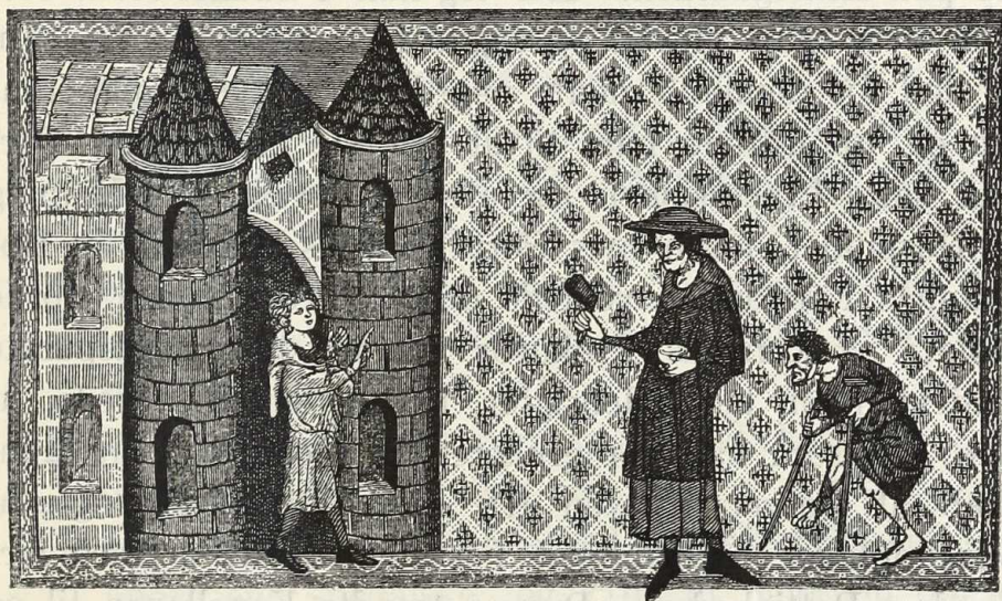
Spedalsk med Skralde

ens Slutning Patientens Kappe, Hætte, Handsker, Skralde, Bælte og Kniv. En Stund efter ankom Præsteprocessionen, der skulde føre ham til Kirken, og Slægt, Venner og Naboer sluttede sig til det uhyggelige Følge, der viste det levende Lig den sidste Ære. I Forhallen passerede Patienten den Vidiebaare, der skulde føre ham til Kirkegaarden, og ovenover Koret bag Højalteret (i Apsis) saa han det udfoldede Ligklæde.