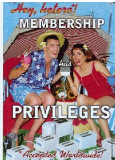
ILLUSTRATION: DEBORAH KELLY & TINA PFELESH

Queer-perspektivet indeholder et opbrud i kønsopfattelsen, men det betyder ikke en nedbrydning af feminismen – tværtimod! Feminismen viser, hvordan køn bliver brugt som en undskyldning for at opretholde social ulighed. Denne tanke bygger que-