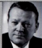
Jens Otto Krag (1962-1968, 1971-1972)