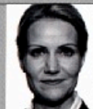
Helle Thorning-Schmidt (2011-)