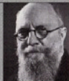
Thorvald Stauning (1924-1926, 1929-1942)