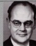
Viggo Kampmann (1960-1962)