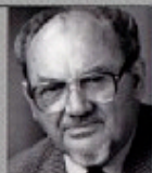
Anker Jørgensen (1972-1973, 1975-1982)