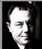
Hans Hedtoft (1947-1950, 1951-1955)