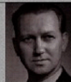
H.C. Hansen (1955-1960)