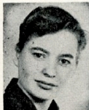
Lone Klem Mag. art. København 4. kreds

VI ØNSKER bedre støtte til enlige mødre under uddannelse.