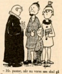
- Hr. pastor, når nu vores søn skal gå til præst hos Dem, hvor tit behøver vi så gå med ham i kirke? - Det behøver De slet ikke gøre, når søn bare De gør det én gang om nogen søndag!

Den samme slags indvendinger mod et kristeligt parti kunne man med lige så stor ret adressere til f.eks. KFUM og KFUK i deres forskellige arbejdsforeninger. Hvad har det med kristendom at gøre at drive lejrskole, at spille fodbold? Man kunne rette samme indvending mod missionsselskabernes咖啡er af skoler og sygehuse, mod eksistensen af Kristelig Lytterforening, ja mod eksistensen af et Kristeligt Dagblad. Hvorfor nøjes man ikke med at gå ind i andre sammenhænge, men fortrækker at etablere sine egne? Svaret er ganske klart. Fordi det kristelige anlæg i disse organisationer kan fastholdes som det primære, og ikke blot være noget sekundært eller parasitært.