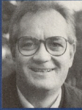
Jens-Peter Bonde, medlem af EU-parlamentet