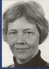
Ulla Sandbæk, medlem af EU-parlamentet