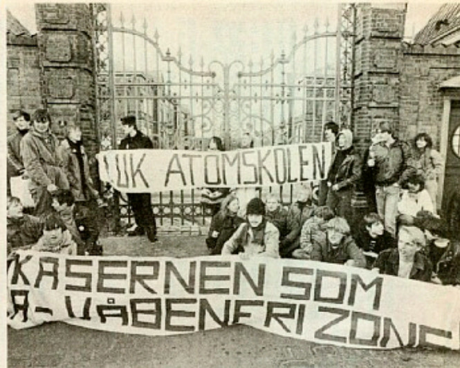
Østerbro Kaserne i København