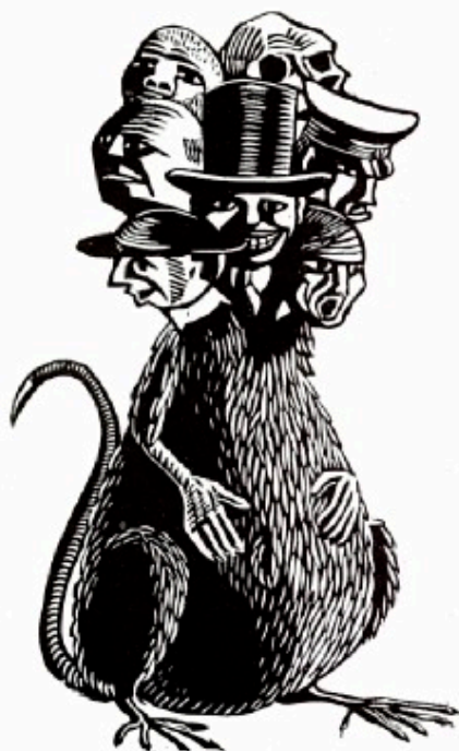
- fascismen - et mangehovedet uhyre

dertrykkelse af U-landene i system og dirigerer de væsentligste dele af den internationale økonomi via bl.a. internationale sammenslutninger som Den Internationale Valutafond og Verdensbanken og i sammenhæng med GATT-forhandlinger og G7-topmøder.