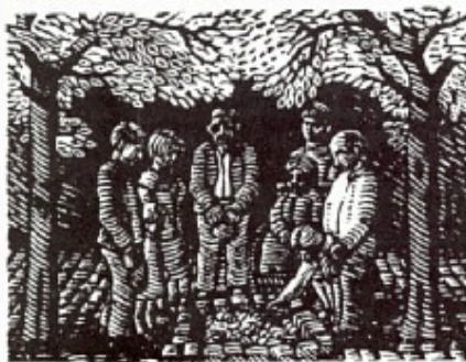
– fra besættelsestiden: Henrettelserne. De dræbte mindes.