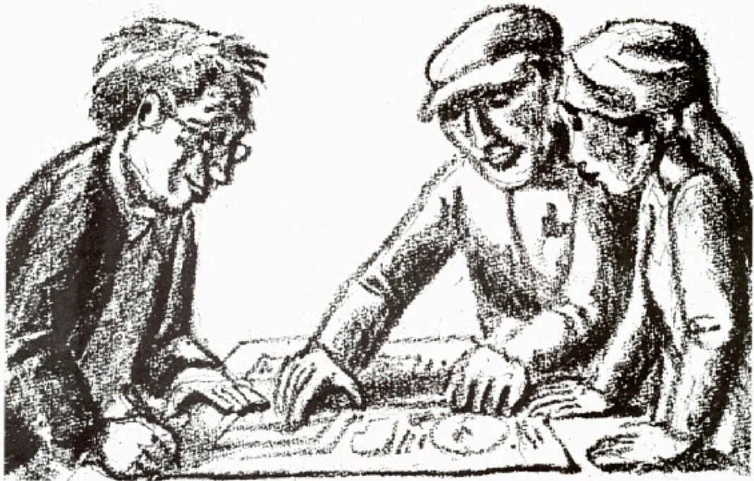
- dialog mellem åndens og håndens arbejdere.