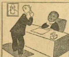
Socialministeren: „Der skal gøres noget. — Lad os sælge Cyst. der.“