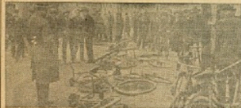
Trængsel paa Kontrolstedet.

Væk med Arbejdsløshedsregeringen. Dette Billedet illustrerer Venstres Valgavis foran Landsdagsvalget i 1930 som Illustration til Regeringens Beskæftigelsespolitik. Delegation var der 60.000 Arbejdsløse. Siden da er der kommet yderligere 3 socialdemokratiske Aar, og Resultatet er nu over 150.000 Arbejdsløse. — Venstre vil vende denne Udvikling og ved en fornuftig Erhvervs politik sætte Folket i Arbejde.