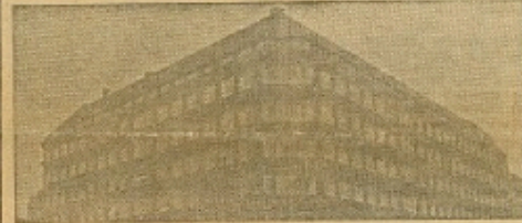
Skattepolitik i København.

Væk med Arbejdsløshedsregeringen. Dette Billedet illustrerer Venstres Valgavis foran Landsdagsvalget i 1930 som Illustration til Regeringens Beskæftigelsespolitik. Delegation var der 60.000 Arbejdsløse. Siden da er der kommet yderligere 3 socialdemokratiske Aar, og Resultatet er nu over 150.000 Arbejdsløse. — Venstre vil vende denne Udvikling og ved en fornuftig Erhvervs politik sætte Folket i Arbejde.