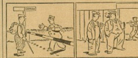
Nær man skal ind i et Land, lyder Spørgsmålet: "Har De Land?"

Vend Klassepartierne og de falske Oppositionspartier Ryggen!