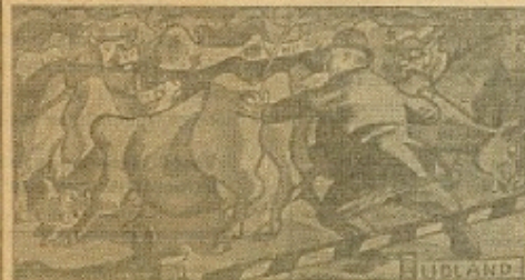
Stansning holder Eksporten tilbage.

Væk med den vridte Skattebyrde, som sætter sig Spor i store og store Skattepalæer. Kontrolstedet og Skattepolitik — Det er Resultatet i Regeringens økonomiske Politik.