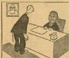
1930. Partisekretæren: „Hv. Socialdemokrater, Arbejdsfælleskabet er nu næsten tre Gange saa stor som i 1929“.