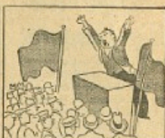
Socialdemokratiske Valgparole 1930: „Vi har sat Cystikjølene i Gang“