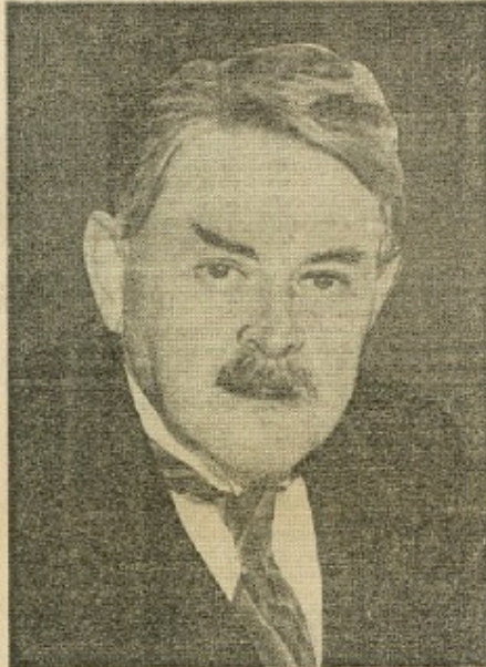
Statsminister V. Buhl.