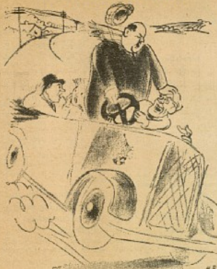
De to Passagerer: Hets Kong og Christianas Høvder skal ikke som Regering, ender til i Graven.