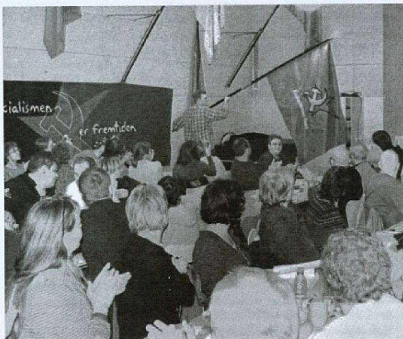
Partiets nye fane præsenteres for kongressens deltagere.