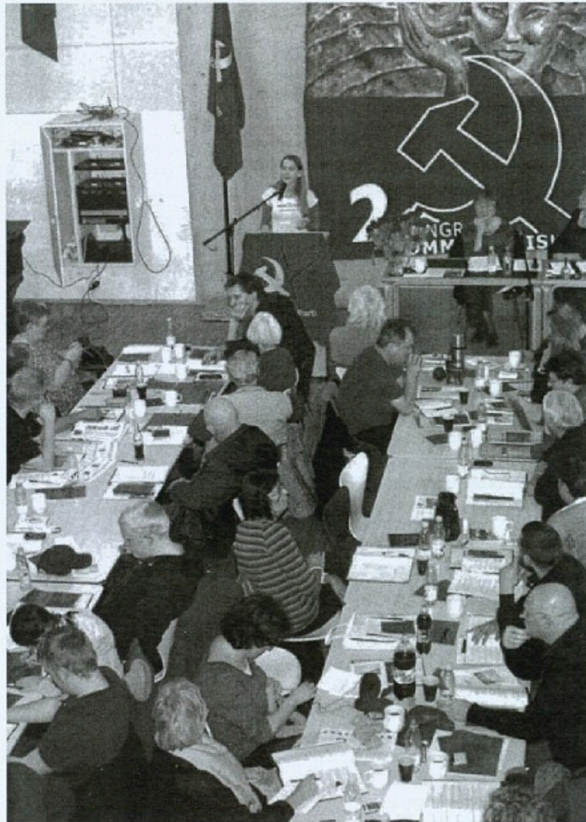
Der var stor talerlyst på Kommunistisk Parti's 2. kongres. Mere end 100 indlæg fra de delegerede under debatten.