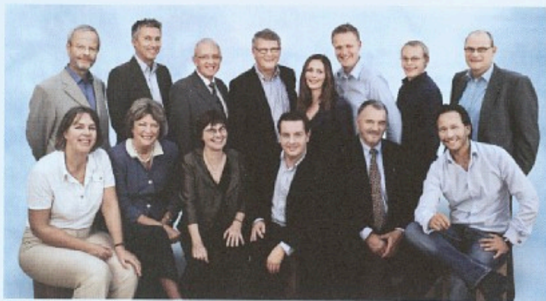
Venstre stillede med et stærkt hold til valget til Europa-Parlamentet.