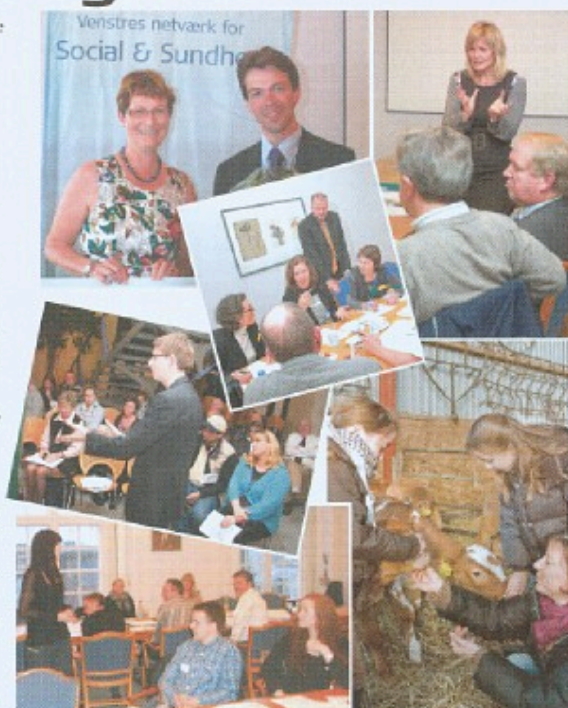
Klip fra nogle af de mange forskellige aktiviteter i de landspolitiske netværk i årets løb.

Netværket for Udland & Sikkerhed. Formand Søren Pind.