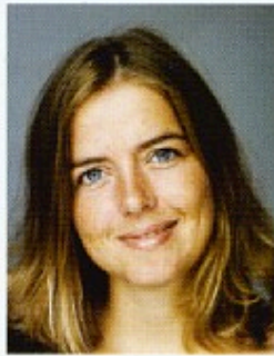
Ellen Trane Nørby Ellen.Trane.Norby@ft.dk