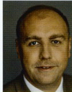
Kristian Pihl Lorentzen Kristian.Lorentzen@ft.dk