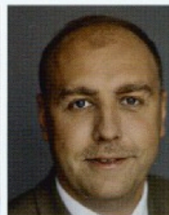
Kristian Pihl Lorentzen Kristian.Lorentzen@ft.dk