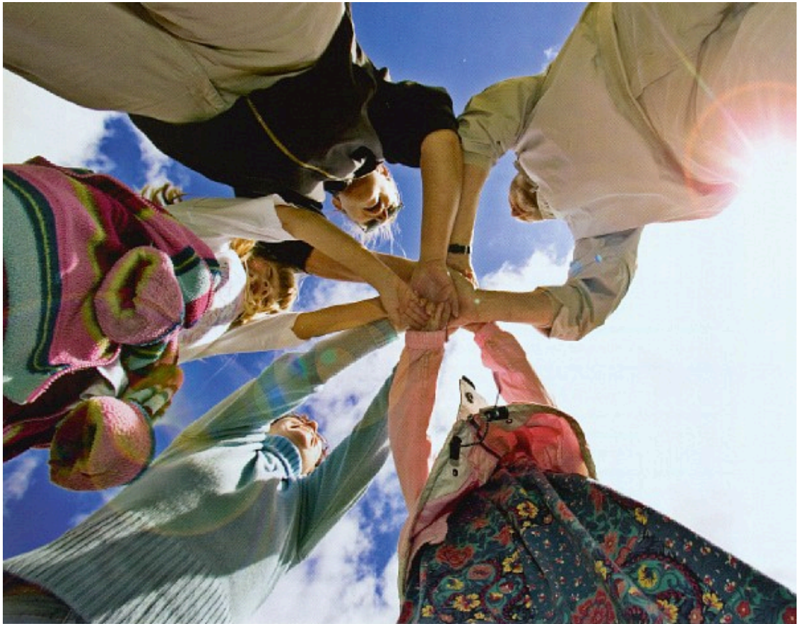
Familjekurser på Esbjerg Højskole, hvor både børn og voksne fra d. 4. – 17. juli 2004 holdt en anderledes ferie. Her var både politisk debat, kreativitet og en masse sjove udendørsaktiviteter.