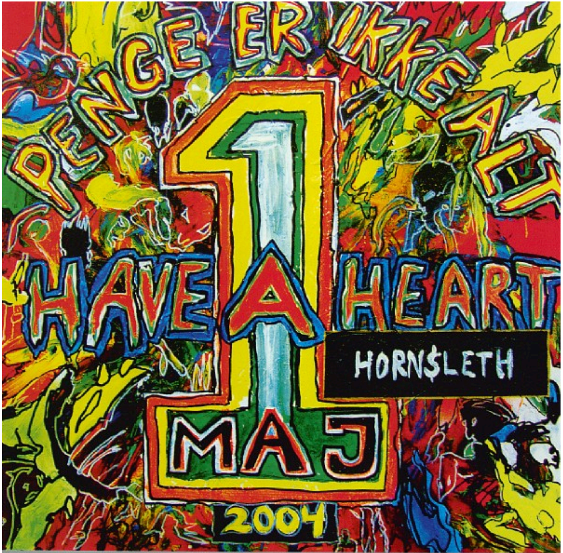
1.maj-plakaten fra 2004, som er malet af Kristian Hornsleth. De sidste par år har unge og moderne kunstnere malet 1. maj-plakaten med stor succes.