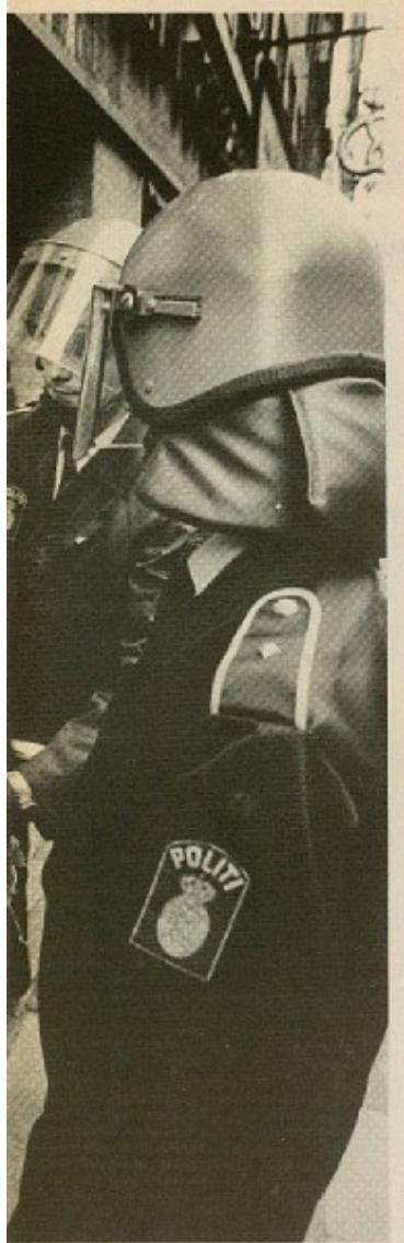
MOD SYDAFRISK FRUGT