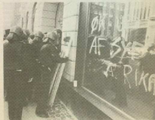
ØK ud af Sydafrika