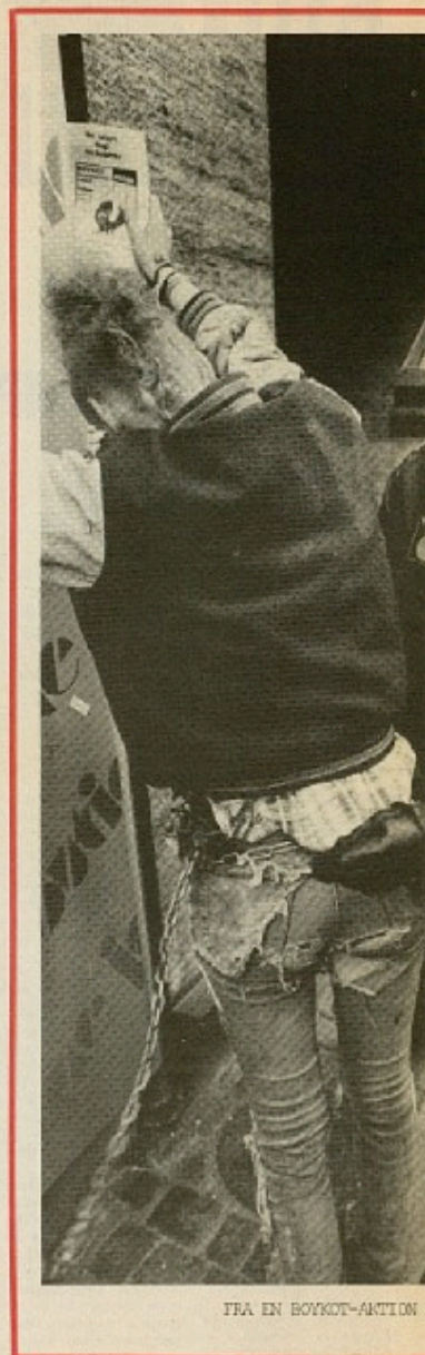
FRÅ EN BOYKOT-AKTION

F.eks. er Zimbabwe for 90% af sin handel afhængig af Sydafrika og er nok det land, som har været mest interesseret i at denne rute kom op af stå. Det har været et stort problem for trans-