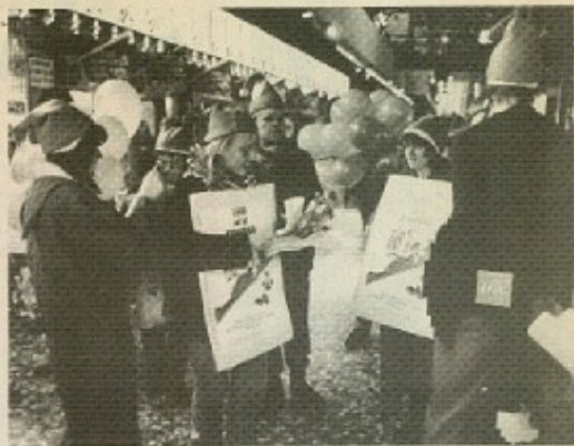
Solidarit på det klodser

Men på kort sigt er det sikkert, at disse mere fremvandede repræsentanter fra den kapitalistiske verden godt kan sige sådan noget i England og USA, men de skal nok holde sig på månen i Sydafrika, hvor de er totalt isoleret. Læse