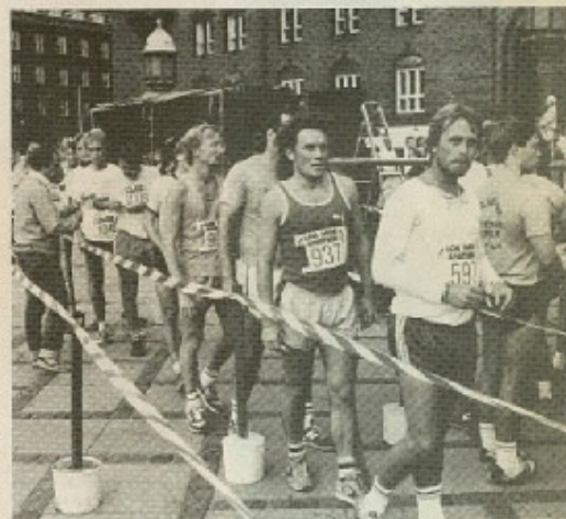
Giv en fod mod apartheid