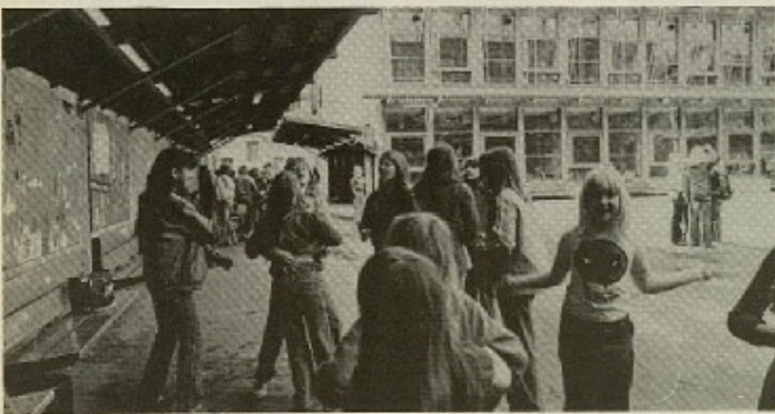
Byrådsmedlemmerne af lokalrådets medlemmer - ved de hvad vi har brug for?

For VS er demokrati mere end et kedsomt ord.