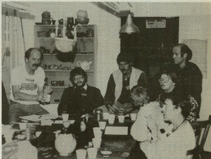
Selvforsamling kræver aktiv deltagelse.

For VS er decentralisering og selvforvaltning mere end udskoling af en passiv gruppe. Selvforvaltning er indbyrdes på egne forhold.