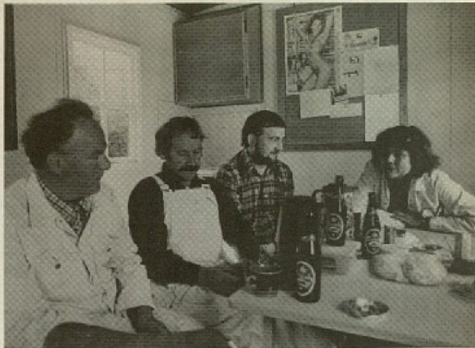
Kampen mod nedskæringer er også en kamp for at sikre kvindens tilknytning til arbejdsmarkedet.

bejde med god samvirkning, læse ordentlige arbejdsgange og arbejdspladser på alle offentlige arbejdspladser.