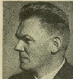
Kirkeminister Arne Sørensen. Medlem af Danmarks Frihedsraad.