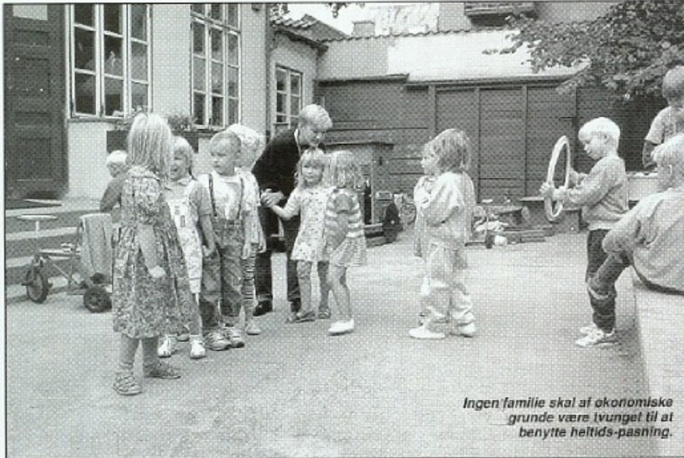
Ingen familie skal af økonomiske grunde være tvunget til at benytte heltids-pasning.

pensation til de lavtlønnede på baggrund af personens samlede indkomst.