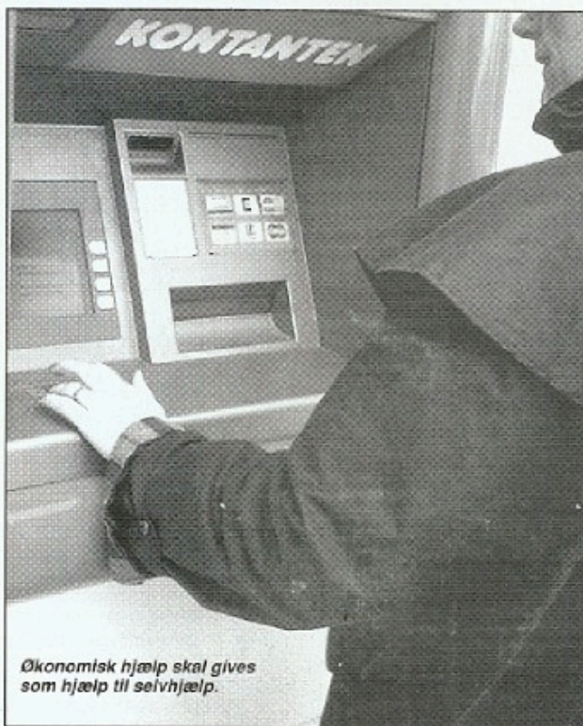
Økonomisk hjælp skal gives som hjælp til selvhjælp.

Enlige forsørgere med barn/børn under 14 år skal have ret til nedsat arbejdstid - f.eks. 30 timer. For at alle enlige forsørgere kan have et reelt valg, skal der gives lønkom-