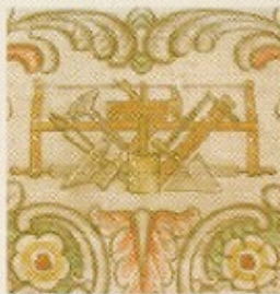
Illustrationerne er fra Rasmus Larsens berømte friser på Christiansborg

dit land - dit valg • dit land - dit valg