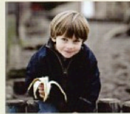
Vi vil styrke kvaliteten i børnepassningen og skabe 7 milliarder kroner til børn og deres familier. Forbedringen af lokaler og en forstærket indsats over for socialt udsatte børn.

20.000 kroner mere til familien Skatteministeriet har udregnet udvælgelsen i risikohedbetalt for en typisk LD-familie med to børn i institution og høje udgifter til kollektiv transport. Tallene viser, at familien alt i alt har cirka 20.000 kroner mere til sig selv i 2004 end de havde i 2001.