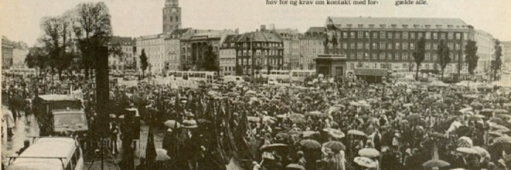
Arbejdstiden skal ned for alle – lønarbejderne skal ikke spilles ud mod hinanden.

Vi mener desuden, at en 6-timers arbejdsdag vil gavne kvindernes ligestilling, og vi mener, at det er vigtigt, at vi tilgodeser både børnenes og kvindernes interesser. Derudover indebærer 6-timers arbejdsdagen så mange fordele for både mænd, kvinder og børn, for arbejdende og arbejdsløse, at vi mener, at en nedsættelse af arbejdstiden naturligvis skal gælde alle.