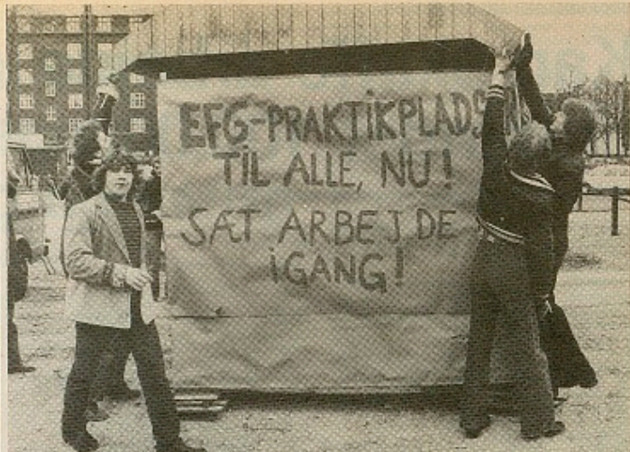
Arbejdsgiverne må tvinges til at oprette de nødvendige praktikpladser

Men vigtigst af alt er, at SF vil arbejde for en samling af lønarbejderne på deres egne betingelser. SF ønsker ikke dette ud fra en snæver partipolitisk interesse. Men ud fra, at en samlet lønarbejderklasse er det eneste værn mod de overgreb og umyndiggørelse, som arbejderne udsættes for i disse år. Kun en samlet solidarisk optræden overfor arbejdsgiverne kan skaffe de forbedringer igennem som er nødvendige, hvis lønarbejderne ikke skal presses mere i defensiven end de er i dag. Og kun en enig fagbevægelse, der arbejder på arbejdspladsernes grundlag kan skabe det fundament, der skal til for at skabe afgørende forandringer i samfundet til fordel for lønarbejderklassen.