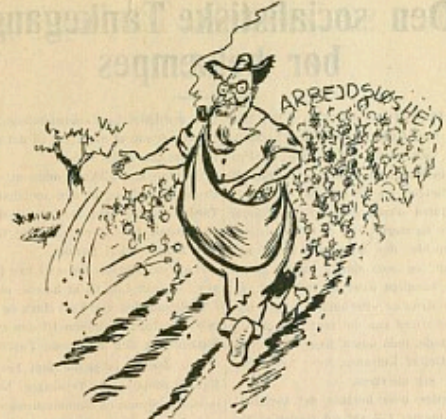
Mr. Stauning har begyndt Vintersnningen.

Maaske danske Bønder og Arbejdere finde hinanden i Enighed om at vælte Monopolsystemet, saa er den værste Hindring ryddet af Vejen. Saa har vort Land skabt Betingelser for, at der kan blive Orden i vort eget Hus, og det er en virkelig, ja, den eneste Nationalpolitik, vi kan og bør føre. Kan vi skabe den størst mulige Tilfredshed indadtil og vise Verden et venligt Ansigt udadtil, saa er Betingelsen til Stede for, at det nationale Sindelag, udsprunget af Kærlighed til vort Land, kan vokse. Her kan vort Land øve sin Iadsats i Fredens Syssel. Kun en Samfundsordning paa Ligerettens Grund med fælles Ejendomsret til alt, hvad Gud eller Naturen har givet os og Privatejendomsret til Arbejdsløn for den enkelte, kan dette kan sikre Kultur, Frihed og Selvstændighed, og kun dette kan sikre Folkestyrets Bestaan.