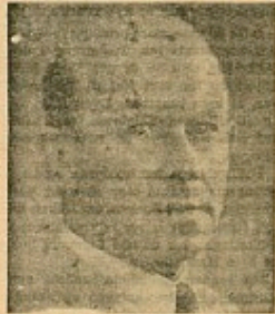
Formand Viggo Starcke, Formand for Retsforbundets Rigsdagsgruppe.

Retsforbundets Fremgang ved de sidste Rigsdagsvalg, hvor Mandatallet i Folketinget steg i 1950 fra 2 til 3, i 1947 fra 3 til 6 og i 1950