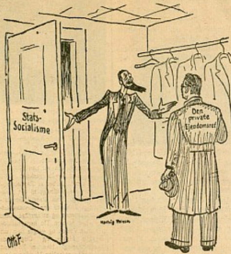
HARTVIG FRISCH: Velkommen! — Vil De ikke af med Overfrakken?