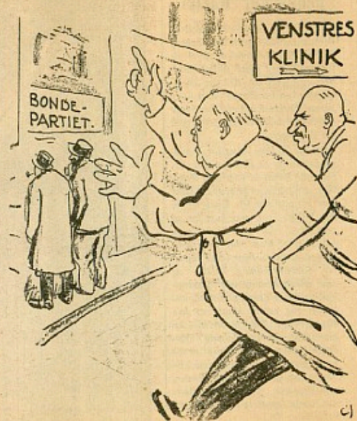
DE GAMLE HERRER: Hallo, De dér! De gaar den gale Vej!

12) Venstre stemte ved Lockoutlovens Behandling imod Bondepartiets Forslag om en Forhøjelse af Sterlingkursen til