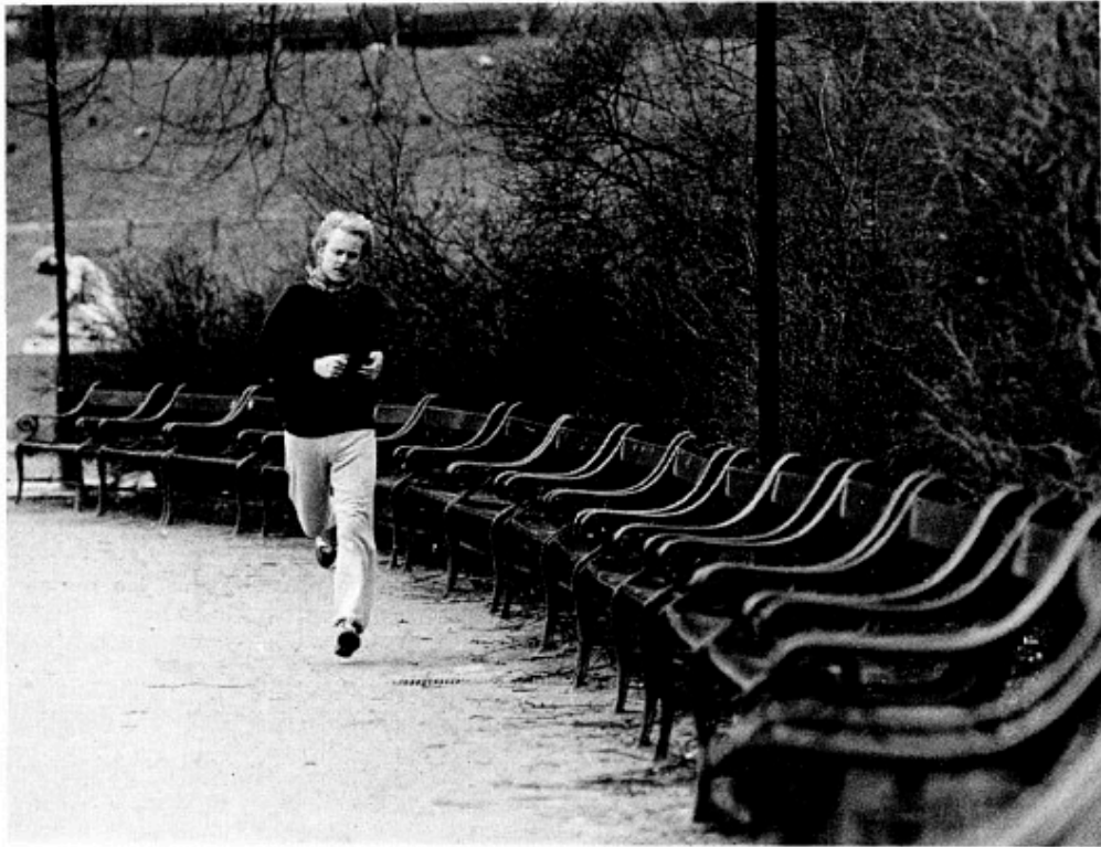
Den ensomme kamp mod kilo(metrene)....