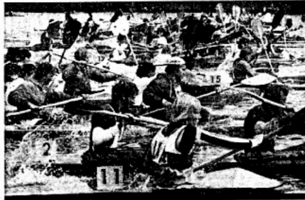
— alle i Tour de Gudend var da ikke mænd

Jeg har besluttet at stille op til bestyrelses-valget!!