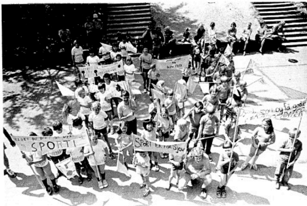
Idræt er en væsentlig del af børns totaludvikling

Og alt dette sker samtidig med, at man i "samfundet" som helhed (folketing, kommunalpolitikere, borgere) er begyndt at åbne øjnene for nødvendigheden af øget fysisk aktivitet - allerede fra skolealderen. Og på trods af al ekspertise (skolelæger, fysioterapeuter, psykologer m.fl.) påpeger, at 2-3 idrætstimer om ugen langt fra er tilstrækkeligt til at sikre elevernes fysiske udvikling - der jo også er en væsentlig del af børns TOTALUDVIKLING.