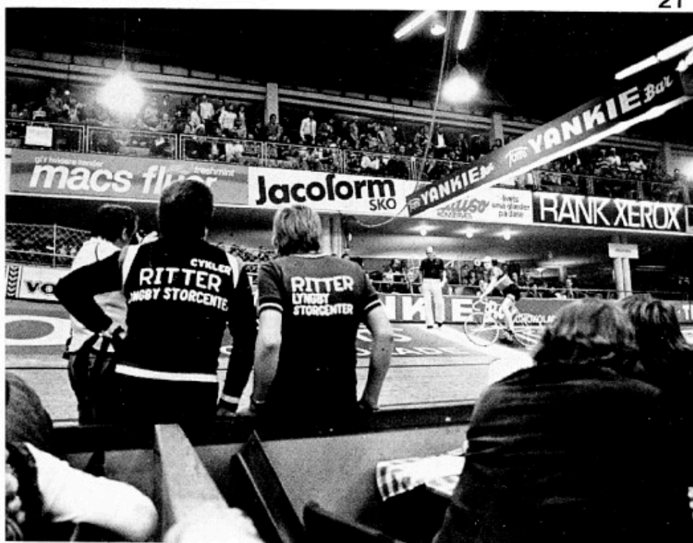
Idræt og økonomi

Her-og-nu-krav: Der arbejdes fra centralt hold med eliteproblematikken. Da det er en vigtig problematik, må det kræves, at arbejdet hurtigt gøres færdigt, så man kan få nogle retningslinier omkring eliten. Som det er nu, er det nærmest jungleloven, der hersker, hvor erhvervslivet kan boltre sig på de professionelle idrætsudøvers bekostning. Især bør der indføres en langt bedre beskyttelse af den enkelte idrætsudøvers tarv - alt for ofte ender det professionelle idrætsliv med, at vedkommende har ødelagt kroppen - og bliver erklæret "idrætsinvalid".