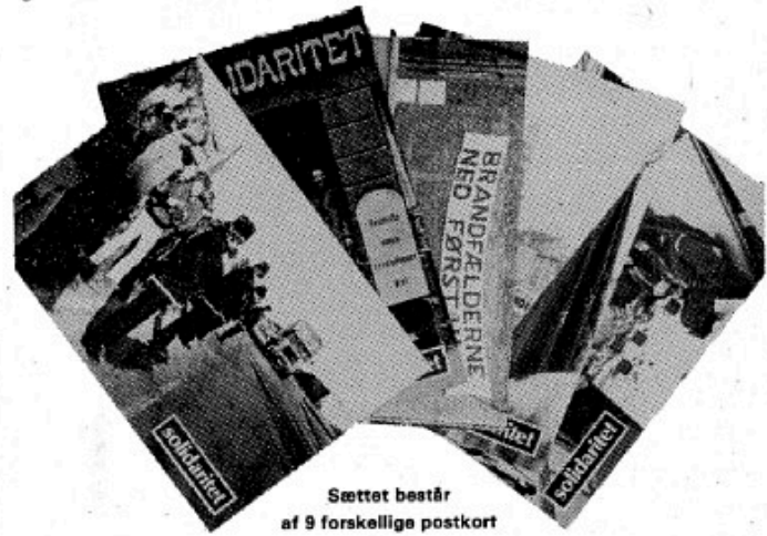
Sættet består af 9 forskellige postkort

Vi kan ikke tilbyde dig en flaske champagne for en ny abonnent på SOLIDARITET, men vi kan tilbyde dig et sæt postkort, som tak for din ulejlighed.