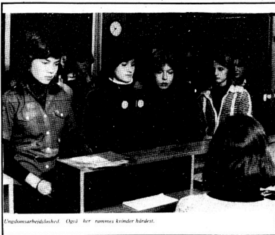
Ungdomsarbejdsløshed. Også her rammes kvinder hårdest.

Undertiden diskuteres det, om skolen skal være samfundets, lærernes, forældrenes eller børnenes. Der kan ikke være tvivl om, hvordan situationen er i dag. Det er samfundets magthavere — i skikkelse af politikere og teknokrater — der bestemmer over skolen. Den indflydelse, som forældre, lærere og børn har, kan være på et meget lille sted. Jeg mener, at først og fremmest børnenes, men også forældrenes og lærernes indflydelse bør være helt anderledes reel. De elevråd, der eksisterer, er ikke meget bevendt, fordi de ikke har nogen kompetence. At give elevrepræsentanter sæde i skolenævn er da et lille fremskridt, men i sig selv betyder det ikke meget. Repræsen-