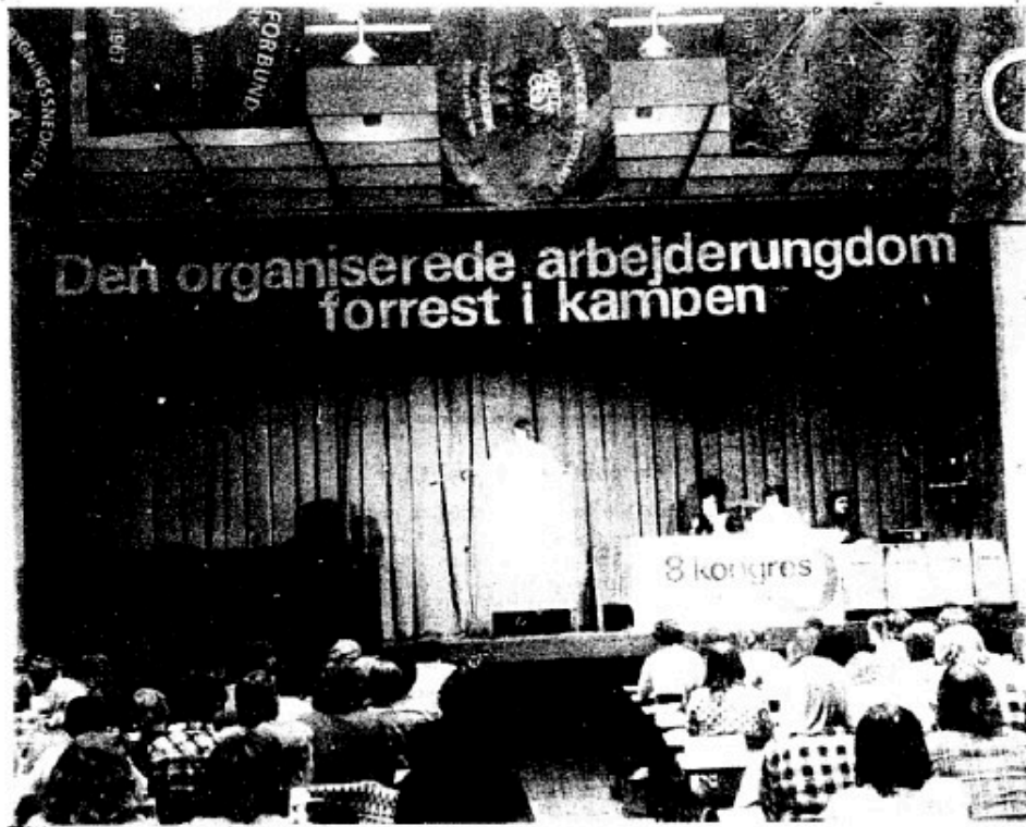
LLO's kongres - lønkrav og EFG i centrum

Birthe, Metal afd. 13 : »Vores overenskomstkrav må være 1) Lærlinge under svendeoverenskomster og garantiløn fra første læreår, altså »fagets mindsteløn«. 2) EFG-lønnen indføres straks og betales af arbejdsgiverne, altså som overenskomstkrav. Klub 20 (klubben på metalskolen i Ballerup, landets største EFG-skole) har kontaktet metal-fagforeningerne i København, og holdt møde for alle lærlingeklubber i København, hvor de havde opbakning bag kravene.