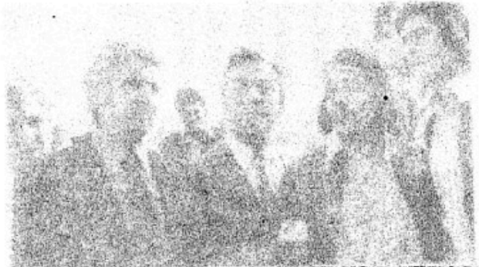
De fem tillidsmænd, havnearbejderne, der blev løsladt med betingelser.

Det fik arbejdsretten til at bøje sig og løslade de 5 tillidsmænd. Men 900.000 kroners boden skal betales, og arbejdsmarkedsloven er ikke afskaffet. Arbejdsretten er blevet tilføjet et nederlag, og dens virke undergraves af den engelske arbejderklasse. Kampen mod den fortsætter. Det samme gør havnearbejderstrejken.