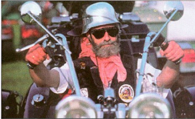
Der skal gribes effektivt ind over for bande vold.