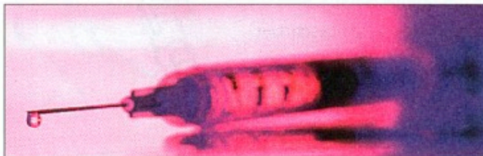
Narkomisbrug og kriminalitet skal bekæmpes. Det gøres bedst ved at fjerne behovet for narko.