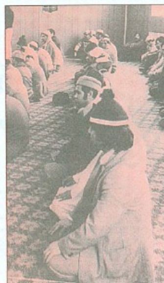
Udlændinge skal selv betale udgifterne til deres tro.

Familiesammenførte skal ikke have rettigheder i forhold til bistandsloven. Hvis ikke de kan klare sig selv, så må de forlade Danmark igen.