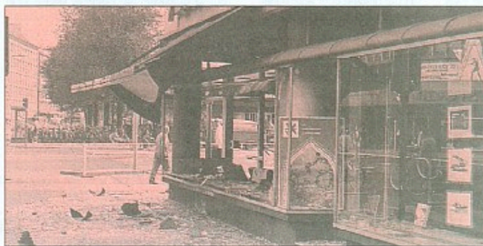
Udlændinge har flere gange stået bag bombe-terror i Danmark.

De danske politikere dummer sig igen og igen, og vores samfund bliver straffet ved at illegale indvandrere straks udnytter hullerne i vores sagsbehandling. Illegale indvandrere skal afvises med det samme på grænsen og sendes retur uden ophold i Danmark og uden ret til sagsbehandling.