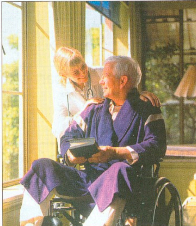
Borgerne skal have tryghed og patienten skal i centrum i sundhedspolitikken.

Det eksisterende lægemiddelmarked er et af de mest regulerende markeder i Danmark. Den omfattende offentlige regulering bevir-