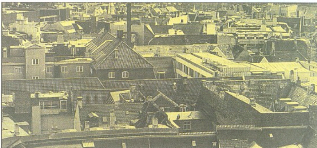
Kommuner og amter skal kunne sænke grundskatterne til nul.