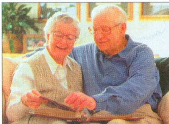
Samfundets ældre har krav på en tryk alderdom efter et langt livs indsats.

Hjælpen kan også bestå af økonomisk hjælp, naturalieydelse eller anden kortvarig hjælp.