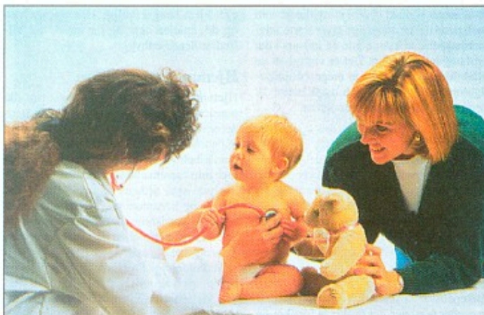
Reglerne for adoption skal lempes.