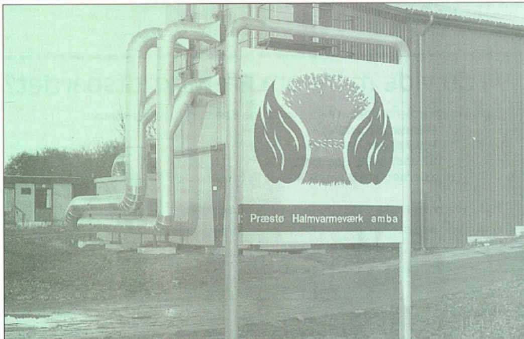
Borgerne skal have et frit og reelt valg – også når det drejer sig om opvarmning af boligerne.

De kommuner, vi har i dag, er en konsekvens af kommunalreformen fra 1970, hvor