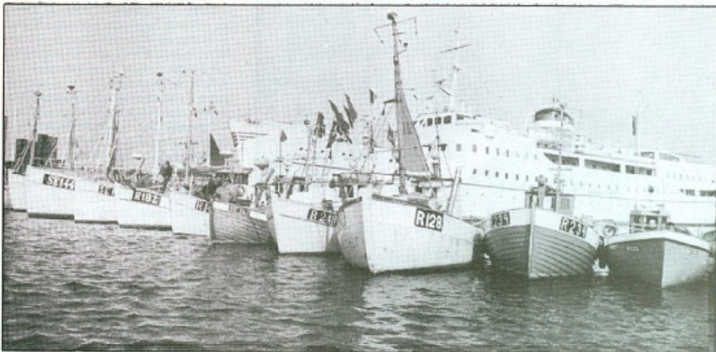
En fiskerihavn kan sagtens placeres i en erhvervszone.

Rådgivningsfirmaet Institutum Europæum, Bruxelles, har medvirket til etablering af ikke mindre end 226 Zoner