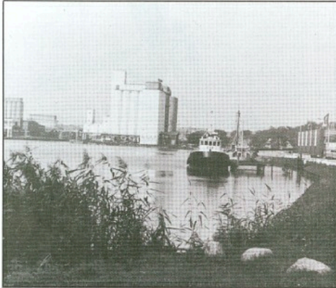
Erhvervszoner er et internationalt afprøvet system, der virker.

Også indkomstkatten kan bringes i overvejelse. I forbindelse med etableringen af DIS (Dansk Internationalt Skibsregister) bortfaldt sømandsskatten. Forudsætningen er, at sømænd ikke længe skal betale sømandsskat af deres indkomst og nettolønnen forbliver uændret, idet nye overenskomster betyder, at skattelettelsen kom rederierne til fordel i form af lavere bruttoløn. Der kan i forbindelse med Erhvervszonerne etableres et DIE (Dansk Internationalt Erhvervsregister), hvor forudsætningen er, at alle eller en del af de beskæftigede på virksomheder i Zonen opnår en særlig personskattelettelse (f.eks. forhøjet personfradrag) mod, at der indgås særlige overenskomster, hvorved virksomheder-