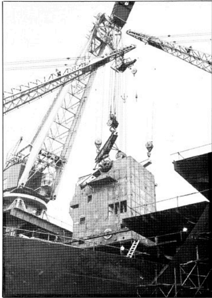
Erhvervszoner giver dansk erhvervsliv bedre konkurrencevilkår.

Netop problemerne med den besværlige og langsomme opnåelse af ret til etablering er i mange tilfælde den direkte årsag til, at virksomhederne opgiver