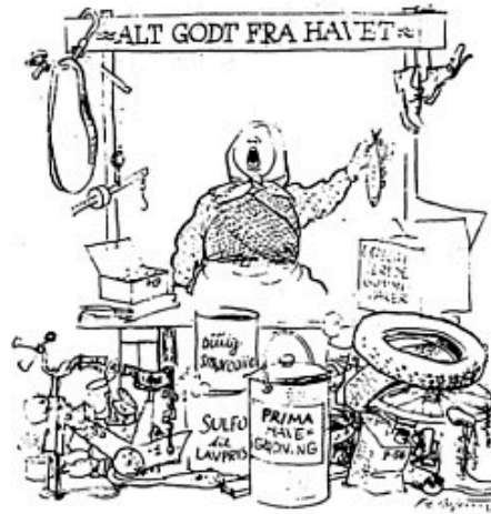
64-75. Utrussulphatet har ændret karakter på det sidste. — Flotte, blanke 1888, lige til at klinge op på væggen som løsmønter ... de er smadretes med bilskrot.

rat bag denne plan. Det kan ventes, at den lider samme skæbne som forsøgene på koordinering af universitetsuddannelserne. →