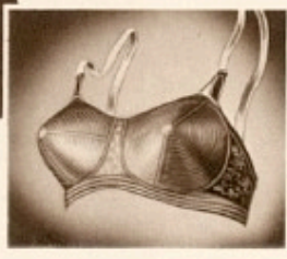
Grunden til den rigtige Paaklædning lægges i den rigtige Kørrestering - som man løser individuelt for at give et tilfredsstillende Resultat . . . .